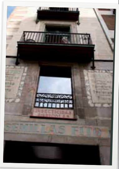
Fachada de la tienda que todavía se conserva en el barrio Barcelonés del Born

"Fue el primero de la familia Fitó en hacer semillas, antes se hacía plantel. Esta fue su gran aportación"