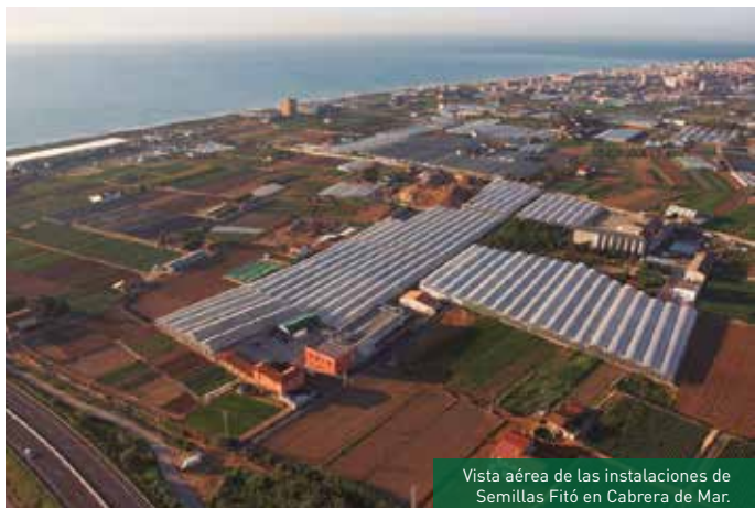
Vista aérea de las instalaciones de Semillas Fitó en Cabrera de Mar.