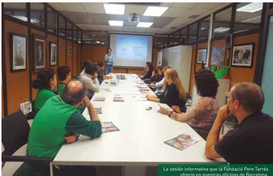
La sesión informativa que la Fundació Pere Tarrés ofreció en nuestras oficinas de Barcelona.

“ El CS Poblenou acoge a 114 niños de entre 0 y 13 años mediante los servicios de espacio familiar, espacio socioeducativo de tarde y casal de verano