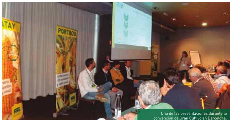
Una de las presentaciones durante la convención de Gran Cultivo en Barcelona.