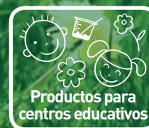
Productos para centros educativos