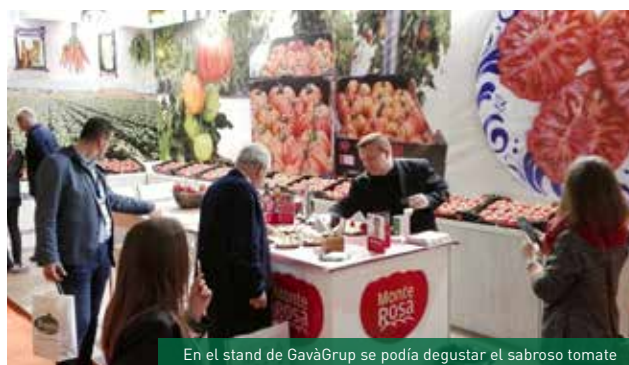
En el stand de GavàGrup se podía degustar el sabroso tomate

La convocatoria se completó con un showcooking a cargo de la bloguera gastronómica Delicious Martha quien presentó recetas de elaboración sencilla que permiten extraer el máximo partido al Monterosa.