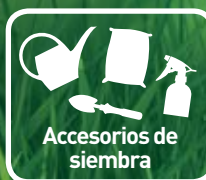
Accesorios de siembra