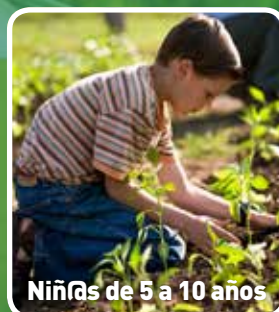
Niños de 5 a 10 años