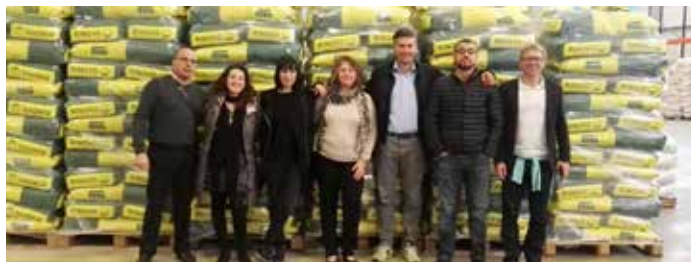
Visita de los trabajadores de la Unidad de negocio de Áreas Verdes, al Centro de Barbens