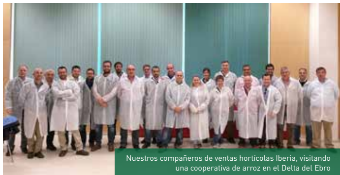
Nuestros compañeros de ventas hortícolas Iberia, visitando una cooperativa de arroz en el Delta del Ebro