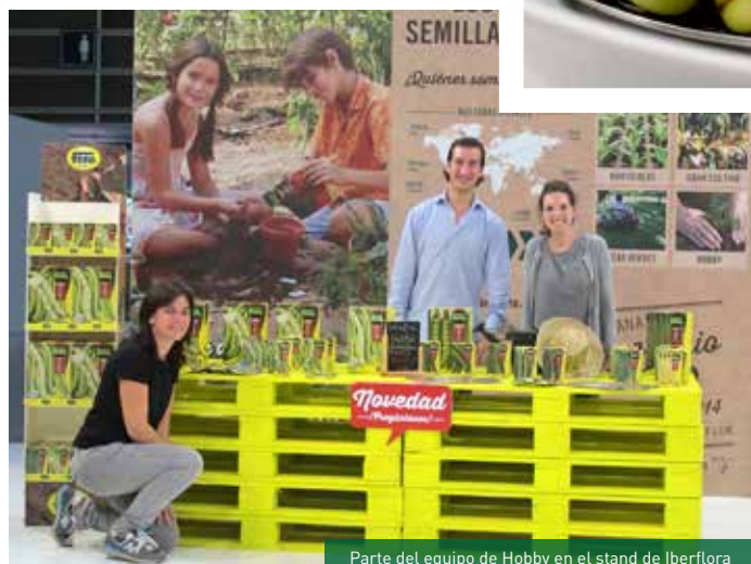
Parte del equipo de Hobby en el stand de Iberflora

Ganamos el Premio a la Innovación en Iberflora 2015 con la variedad de haba Fabiola.