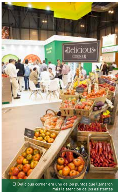
El Delicious corner era uno de los puntos que llamaron más la atención de los asistentes