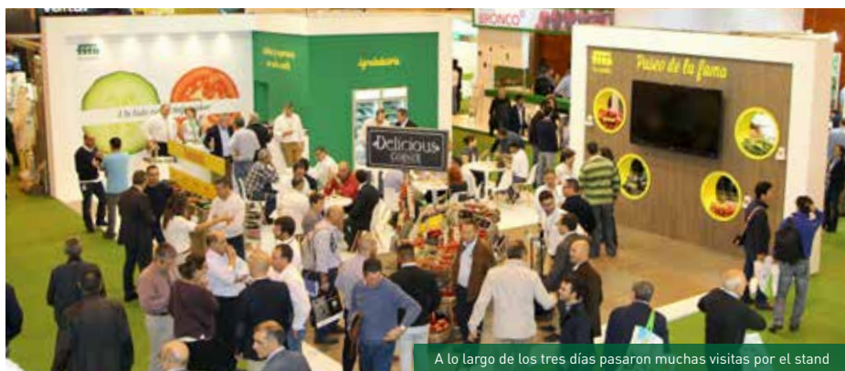
A lo largo de los tres días pasaron muchas visitas por el stand

Durante el pasado mes de octubre se celebró la feria Fruit Attraction en la cual no perdimos la oportunidad de presentar numerosas novedades en Hortícolas para fresco con la ayuda de un stand propio moderno y atractivo.