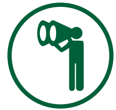
VISIÓN A LARGO

Desde julio y a lo largo de estos meses hemos iniciado una campaña para potenciar los valores Fitó. En todos los centros de Fitó se han trabajado los mensajes de misiones y valores a través de cartelería. En todas las filiales se puede observar el mismo cartel, que cuenta como somos. Además, se ha adaptado a los distintos idiomas de las zonas para que se entienda en todos los países donde está.