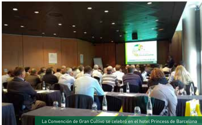
La Convención de Gran Cultivo se celebró en el hotel Princess de Barcelona