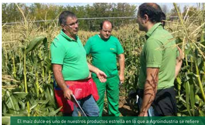
El maíz dulce es uno de nuestros productos estrella en lo que a Agroindustria se refiere

Los pasados 30 de Septiembre y 1 de Octubre se celebraron en Toro (Zamora) los días de campo en los que nuestra empresa, juntamente con la empresa americana IFSI (con la que Fitó colabora en la mejora de maíz superdulce) y nuestro cliente Huercasa, invita a los clientes más importantes de España a visitar los ensayos de mejora que, como cada año, venimos realizando para seguir desarrollando nuestras mejores variedades, líderes en el mercado español.